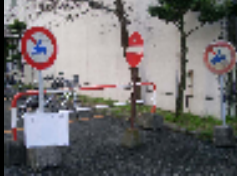
サインが混雑している例