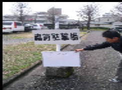
可動式サインの例