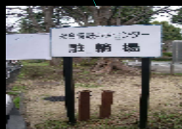
固定式サインの例