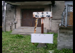
劣化しているサインの例