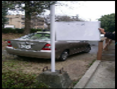
用途不明なサインの例