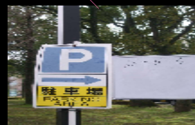
方向表示サインの例