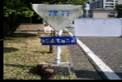
劣化しているサインの例