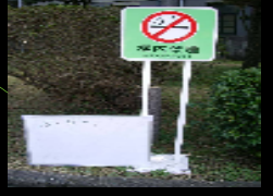
禁止、注意、マナー等 表示サインの例