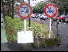
サインが混雑している例

今なぜキャンパスサインなのか～キャンパスサインを改善することにより 快適性、利便性、安全性などが向上しよりよいキャンパスライフが送れると考えたから～