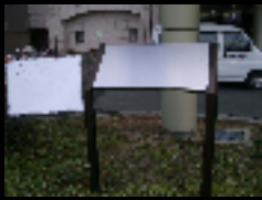
用途不明なサインの例