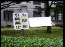
禁止、注意、マナー等 表示サインの例